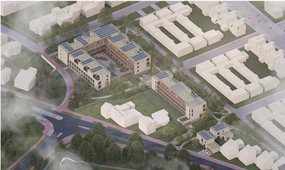
Figuur 1: 3D-impressie van het planvoornemen

Het plangebied is op onderstaande 3D-impressie weergegeven.